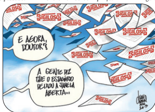
18/08 - Dia do Estagiário

Um homem rindo muito conta para o amigo: - Hoje às 03:30 da manhã entrou um ladrão lá em casa... O amigo diz: - Caramba, cara!!!! Um ladrão entrou na sua casa e você está rindo??? E o que ele levou? E o homem responde: - Levou uma surra ... minha mulher achou que era eu chegando bêbado.