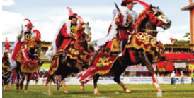
Cavalaria Senhora dos Remédios - MG

sente na cultura brasileira até os dias atuais. É uma festa muito popular que acabou caindo no gosto dos brasileiros, afinal quem não ama as comidas típicas dessa época do ano, as roupas, a imensidão de cores vibrantes das bandeirinhas e danças animadas?