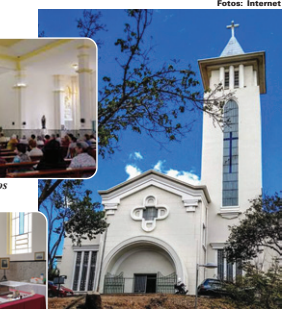
Igreja Matriz de Santo Afonso de Ligiório - Bairro Renascença