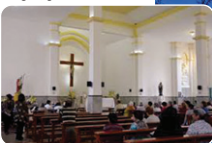
Celebrando 82 anos de sua criação