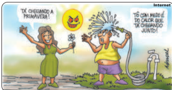
22109 - Início da Primavera

Depois de alguns minutos continua: - 50.000 pessoas, 22 jogadores, 3 juizes, 1 bola... Mais, alguns minutos continua... - 50.000 pessoas, 22 jogadores, 3 juizes, 1 bola... Até que o homem ao lado se irrita e pergunta: - Porque você ficou falando isso toda hora, me explique direito o que é isto? - Está bem vou dizer, é que: - 50.000 pessoas, 22 jogadores, 3 juizes, 1 bola e uma pomba vem defecar logo na minha cabeça!!!