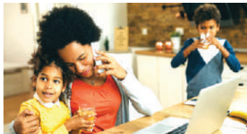
Mulher e sua múltipla jornada de trabalho

A representatividade da mulher também é muito baixa na política brasileira. O Senado Federal é composto por apenas 15 mulheres, entre 81 representantes. Em Brasília a Câmara, entre 513 deputados federais, 91 mulheres foram eleitas em 2022, entretanto devido a licenças para ocupar outros cargos, como mi-