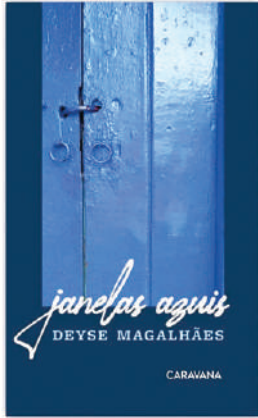
Capa do livro